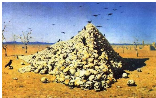
3. Верещагин «Апофеоз войны»