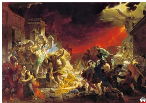
2. Бреллов «Последний день Помпеи»